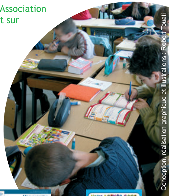
Conception, réalisation graphique et illustrations : Robert Touati

Pour une présentation détaillée de l'Agenda coop, rendez-vous sur le site Internet : www.occe.coop/agenda